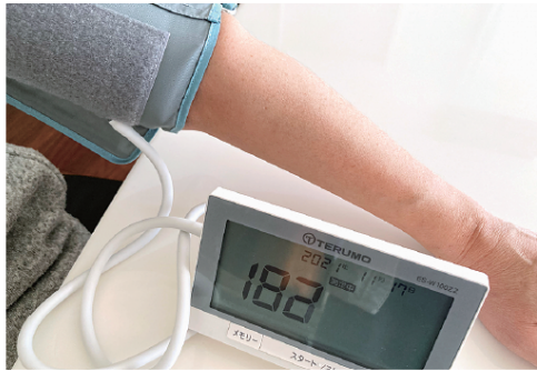
上腕用血圧計。腕に巻いているのが、動脈を圧迫するマンシエツト

まずは、自分の血圧を知ることが重要。動脈の中の圧を、上腕・手首・指等で測る測定器が市販されています。マンシエツト等で高い圧をかけて血管をつぶし、徐々に緩めて血液が流れ始める時の圧が最高血圧です。手首計測は簡易ですが、2本の骨に2本の動脈があるのでうまく計測できない場合も。半面、上腕は骨・動脈各1本のため、再現性が高くおすすめです。コ