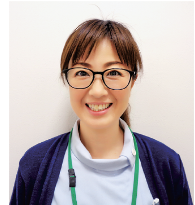
福島県糖尿病療養指導士、心臓リハビリテーション担当看護師